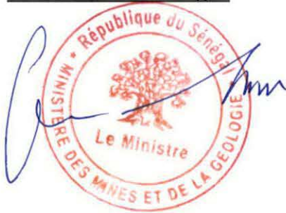
Monsieur Oumar SARR Ministre des Mines et de la Géologie