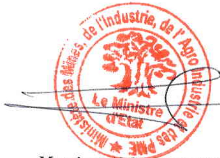
Monsieur Abdoulaye BALDE Ministre d'Etat, Ministre des Mines, de l'Industrie, de l'Agro-industrie et des PME