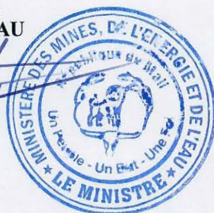
Lamine Seydou TRAORE