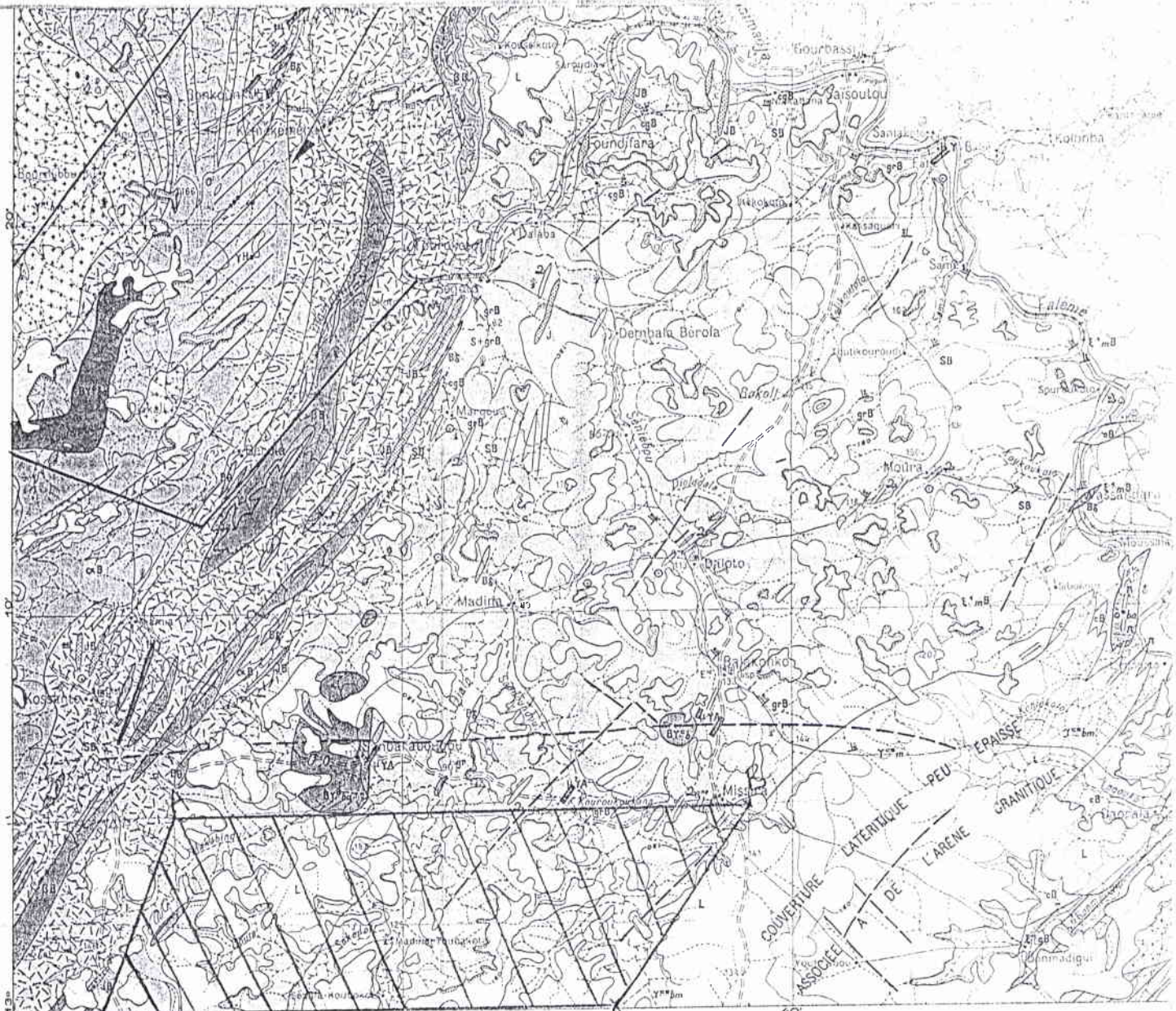
Fond topographique de la carte de l'Afrique de l'Ouest au 1:200 000. Feuille ND. 29 VII Institut Géographique National PARIS. Annexe de DAKAR