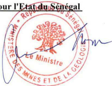
Monsieur Oumar SARR Ministre des Mines et de la Géologie