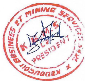
Monsieur le Directeur General

Pour la société KEDOUGOU BUSINESS AND MINING SERVICE