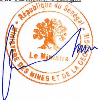
Monsieur Oumar SARR Ministre des Mines et de la Géologie

Pour la société KEDOUGOU BUSINESS AND MINING SERVICE