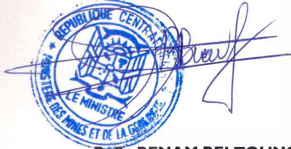
Rufin BENAM BELTOUNGOU Ministre chargé des Mines et de la Géologie